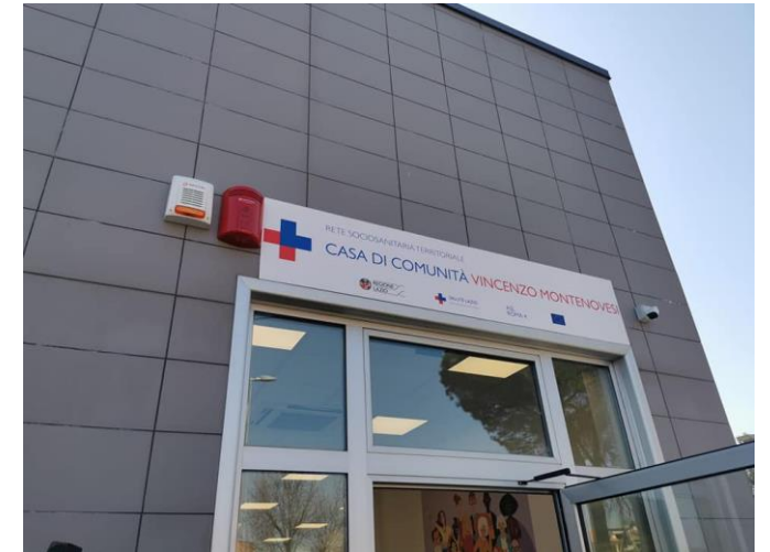
Casa di Comunità, Fiano Romano